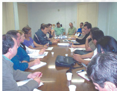
Reunião prévia ao CO de 25/10: ação coesa dos membros do "Chapão"

Muitos outros exemplos poderiam ser cita-