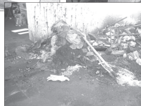
A caldeira do HC, em Botucatu: cenário de guerra